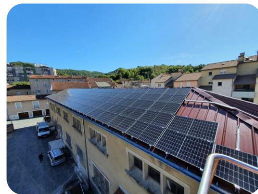
Sainte-Affrique : salle du CAC