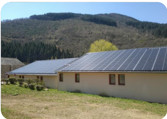
Brusque : Village VVF

pour la présentation du 1 er projet « soleil des grands Causses » et le lancement de la collecte de fonds