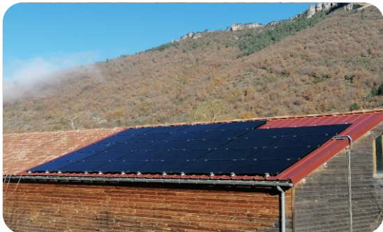
Nant : Centre Equestre