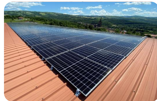
Belmont : gymnase