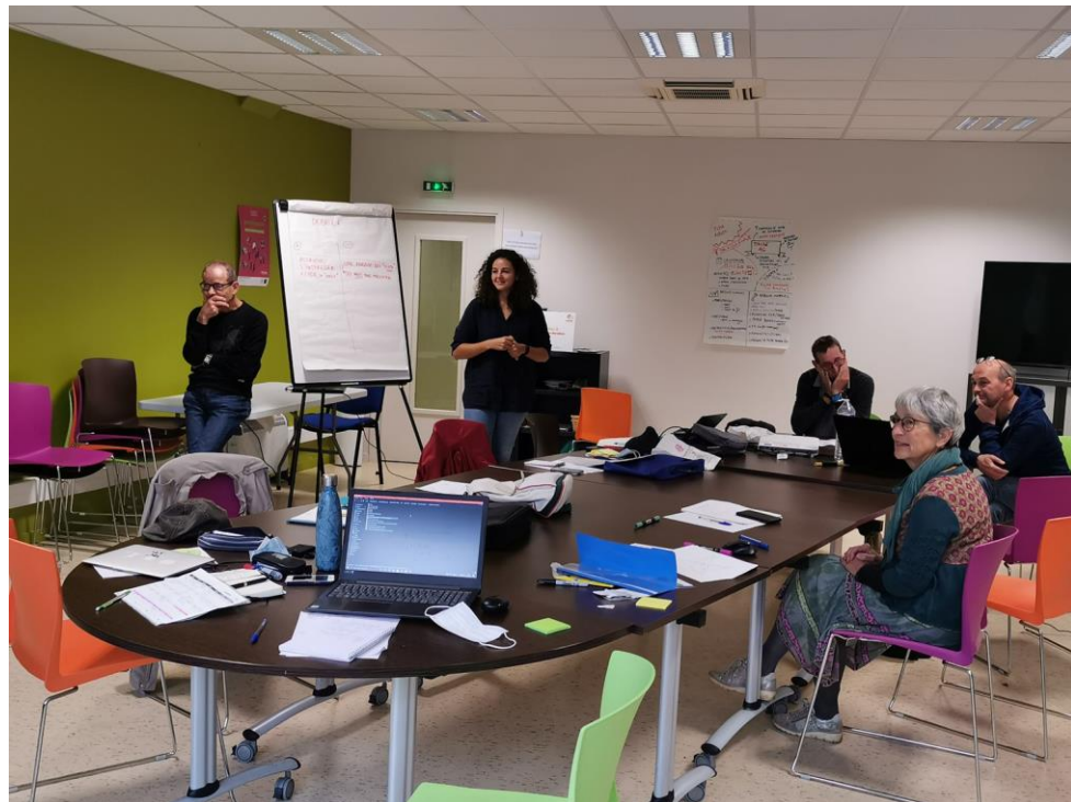
Atelier du 4 Octobre : organisation de la collecte (avec ECLR Occitanie)